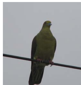
天の父は鳥をも、かえりみられる

個人的な話で恐縮ですが、私もこの世で一家の働き手、夫として、父として仕事をしてきました。その仕事の中で聖書を信じる者としての心がけは、上記に書かれているように、まず「神の国と神の義」を求めることでした。教会へ通うために、日曜日は仕事を断り、またキリストの教えや教会の奉仕を優先して仕事を行ってきたのです。それでどうなったか？と言うと、首になったり、左遷されたか？と言うとそうではなく、ずっと我が家の経済は守られてきました。聖書のことばは真実であることを知りましょう。